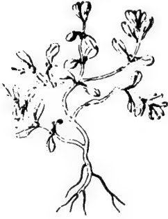
رجلة، بقله، وفرحين Portulaca Sativa

وقد ينفع في أدوية الرحم وفي أخلاط الأكحال، وإذا حقن به غير مغلى نفع من إنصباب المرة الصفراء إلى الأمعاء وأمسك ما حدث عنها من الإسهال. وبزرها ينفع من القلاع والحر في أفواه الأطفال.